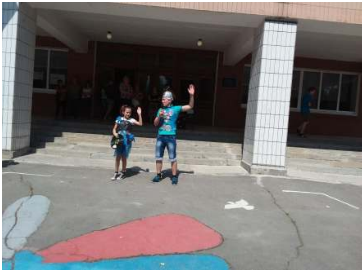
Середа, 31 травня.